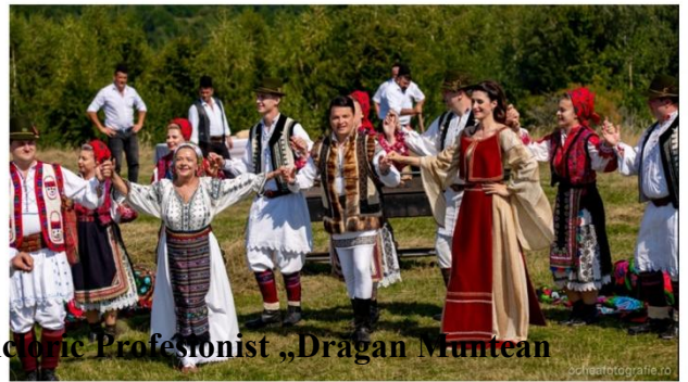
Aniversare 10 ani activitate Ansamblul Folcloric Profesionalist „Dragan Muntean”