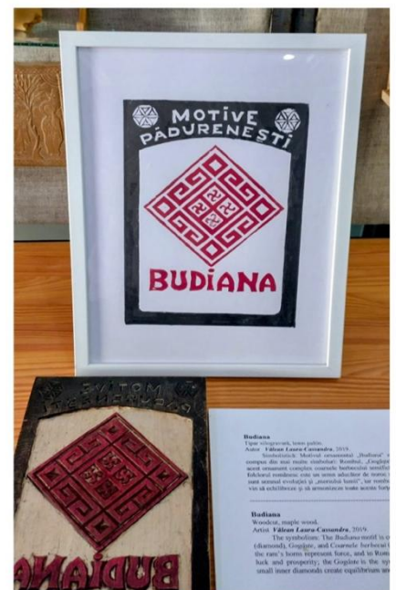
Budiana Tipar xilografică, lemn palin. Autor: Fălean Laura-Cassandra , 2019. The symbolism: The Budiana motif is a complex one with multiple meanings: "Budi" - a complex word containing several traditional motifs. The motif is a diamond shape with a complex internal design, and it is a traditional motif from the region of Lelese. The motif is a diamond shape with a complex internal design, and it is a traditional motif from the region of Lelese.