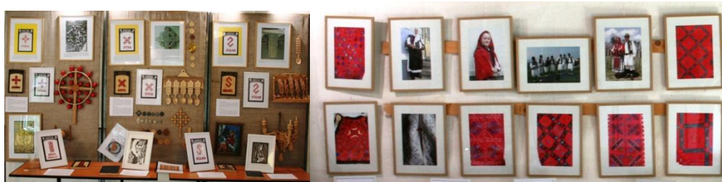
Imagini din expoziția de la Muzeul „Astra” unde au fost etalate 143 de exponate.

- expoziția organizată de Muzeul Textilelor Băița în colaborare cu Centrul de Cultură și Artă al Județului Hunedoara, sub denumirea „ Simbol și splendoare – xilogravuri inspirate din motivele ancestrale ale cămășilor pădurenești ” și la Galeriile FORMA, Deva, sub egida Centrului de Cultură și Artă al Județului Hunedoara, sub titulatura „ Valori culturale tradiționale din Pădurenii Hunedoarei ” (26 martie).