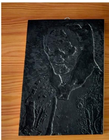
Femeie din Lelese Tipar xilografică, lemn palin. Autor: Fălean Laura-Cassandra , 2019. Lucrare inspirată după fotografia „Femeie din Lelese” de Romulus Vuia, 1929. Woman from Lelese Woodcut, maple wood. Artist: Fălean Laura-Cassandra , 2019. Work inspired by Romulus Vuia's photo „Femeie din Lelese.” (Woman from Lelese.) 1929.