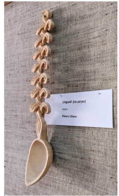
Lingură (cu sarpe) Autor: Finaru Liliana