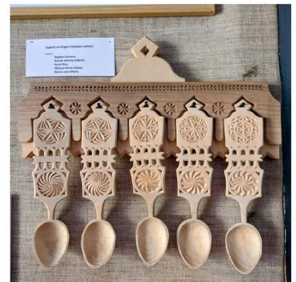
Spărgut cu făină (făină și apă) Autor: Finaru Liliana