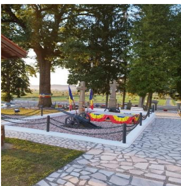
Complexul de Monumente Țebea

Complexul de Monumente Țebea și Casa-Muzeu Avram Iancu din Baia de Criș au înregistrat în 2023 un număr de 18.990 de vizitatori;