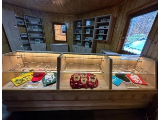
Pavilionul de lemn de la Grădiștea de Munte – Sarmizegetusa Regia

Alte activități derulate în cetățile dacice din Munții Orăștiei: