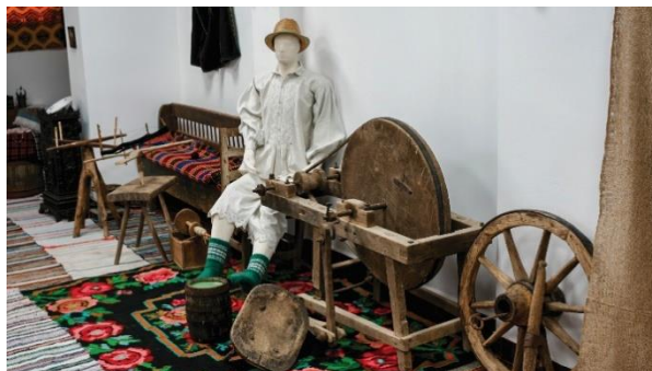
Expoziția Etnografică Zestrea Apusenilor din Vața de Jos

În anul 2023, aproximativ 500 de persoane au vizitat Expoziția Etnografică „Zestrea Apusenilor” din Vața de Jos;